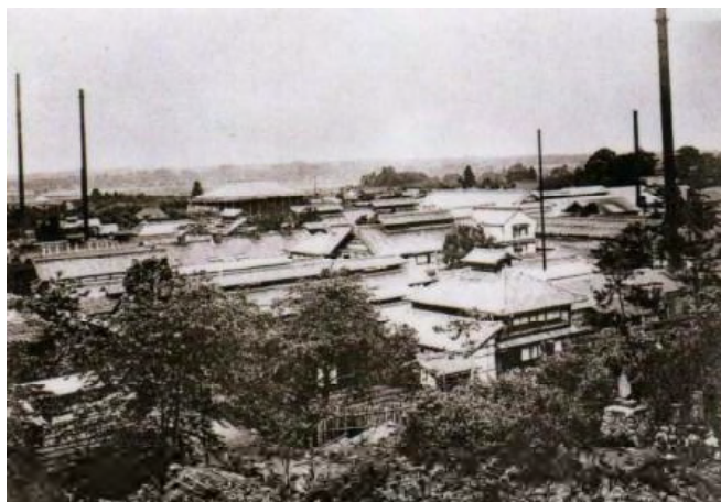
石川組製糸本店工場（現・県営黒須団地）

西洋館は2001年に国の登録文化財となり、03年に石川本家から入間市に寄贈された。現在は年に数回の臨時公開が行なわれている。